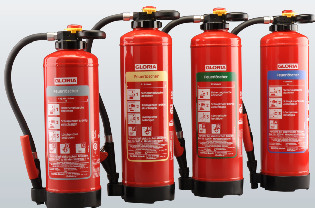
Pulver Schaum Öko-Tipp Wasser